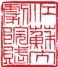
江苏大剧院赋 徐利明

戏曲奏，歌剧从，综艺秀，音乐洪。聆珠玉之错落，遏行云于长空。声清越而绕梁，色婉转以惊鸿。舞台人生，明是非及善恶；人生舞台，辨妍媸与奸忠。祸积于微，戏从教化鄙；智困所溺，艺劝善而移风。审声识音，敬弦歌之有节；察乐知政，传善美于无穷。举复兴之大帜，臻德艺于双丰，颂盛时而庆凯，腾中华之巨龙。