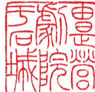
由是营剧院于石城 刘家骏