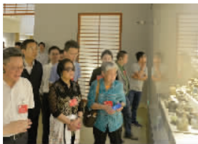
嘉宾参观南京博物院