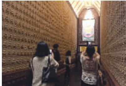
嘉宾参观牛首山文化旅游区