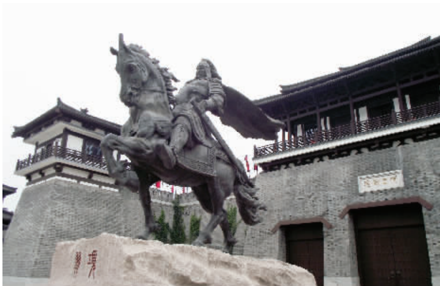
西楚霸王出生地，项王故里沐英风