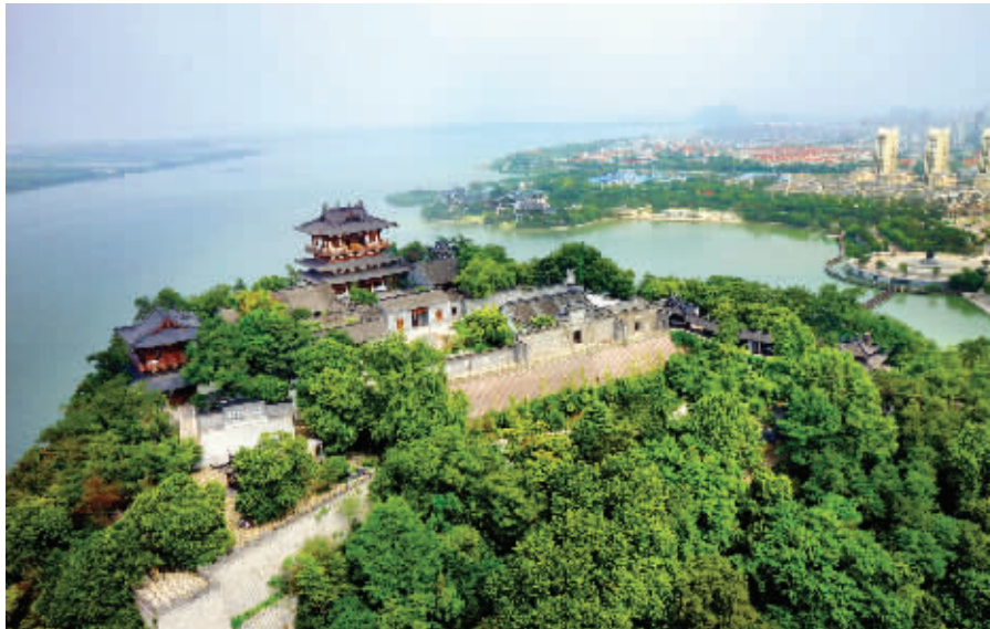
俯拍北固山