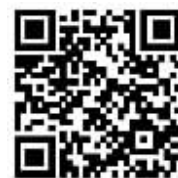
扫码听乡音诵诗词