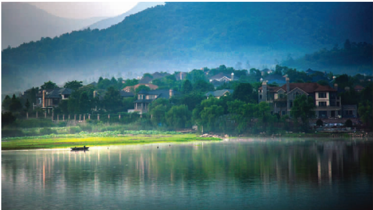
画中人家

家乡的美,总在诗人的笔下流光溢彩。浦口区有多美?这些年来,发展得怎么样?浦口区诗词协会的爱好者最有发言权。南京三桥建成、长江隧道通车、地铁10号线开通、江北新区成立……浦口区每一个重要的时间节点,他们都会创作诗词感怀,来记录“生于斯养于斯”的这块土地翻天覆地的变化。最美不过家乡。在诗词爱好者眼里,写不尽诗词,道不尽浦口美。