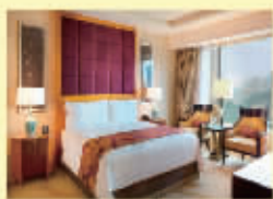
澳门金沙城中心 康莱德酒店