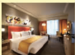
澳门金沙城中心 假日酒店