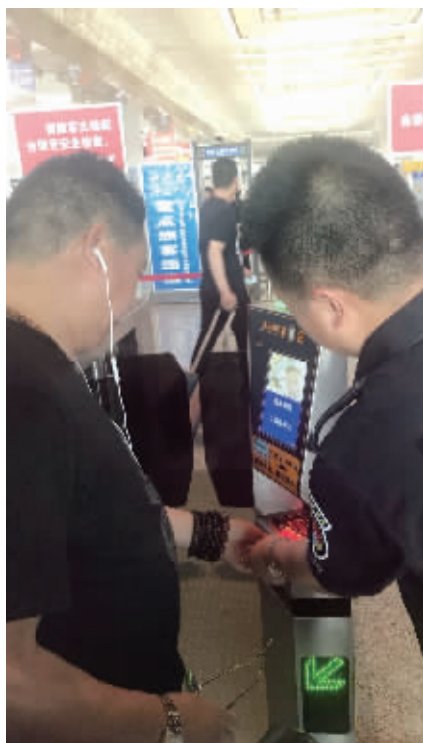
安检人员指导乘客如何“刷脸”

检的时候乘客就喊慢,现在“刷脸”识别了,乘客还是觉得慢,可能是因为还没有适应吧。“等乘客适应了,就能体会到面部识别系统好用。”该工作人员透露,如今最大的困难不是乘客的抱怨,而是很多乘客不会使用,并且有一些车票二维码系统无法识别,就需要人专门再检验一次。“虽然如此,但依旧比原来伸手一直拿票人工安检省时方便许多。”