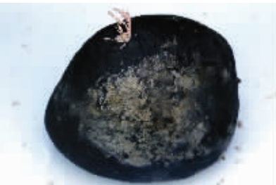
长在石头上的珊瑚样品