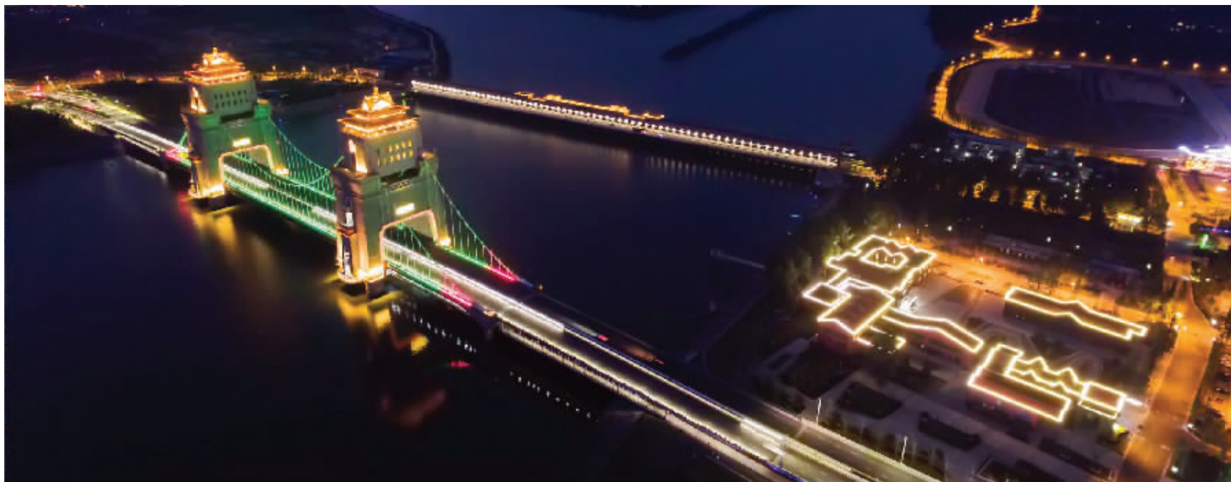
扬州万福大桥,世界首座“悬索塔楼”景观桥,全长664米,主跨188米,是我国首座塔梁古建相结合的双层景观桥,也是扬州城市新地标