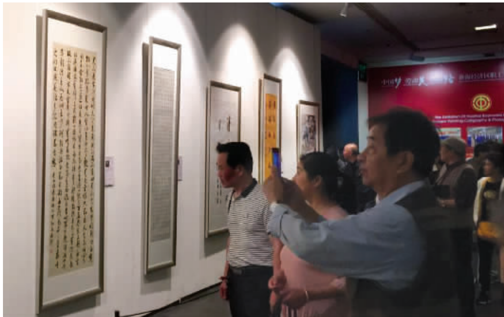
书画作品吸引了众多市民前来观赏

此次职工书画摄影展收到淮海经济区18个城市职工群众创作的作品3000余件,数量众多、题材广泛、主题突出、特点鲜明,多数作品有筋骨、有品格、有温度,以特殊事情和意境,聚焦真善美、传播正能量,反映了广大职工群众的精神风貌和艺术追求,活动对推动淮海经济区文化大繁荣、大发展起到了积极作用。