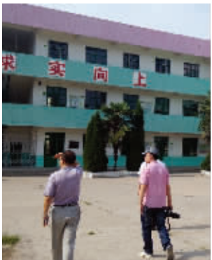
校园如今的面貌(左)、2014年以前的面貌(右)

徐州市解放路小学下河头校区,一座有近80年历史的村小,近年来发生了天翻地覆的变化。从校区校舍的升级改造到课程理念的再造创新,无不显示这所小学活力与激情。