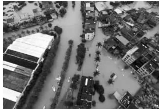
广州部分城区淹水

7日,广州市多地突发特大暴雨。广州市三防办通报,强降雨已造成广州市花都区花山镇和花东镇、增城区中新镇、黄埔区九龙镇等地出现严重水浸。全市倒塌房屋172间,安全转移群众6925人,全市暂未收到人员伤亡报告。