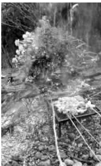
把树枝折断点火烤肉

进入5月,四川凉山州境内的高山杜鹃陆续开花,漫山遍野的杜鹃花海,吸引了不少游客。上个周末,凉山州普格县海口牧场的杜鹃花海在网上走红,被誉为“凉山最美杜鹃花海”,可是,就在这两天,这片花海却惨遭游客“毒手”,除了留下遍地垃圾,还有不少花枝被折断。同时,在凉山的另外一些杜鹃花观赏地,有人开着皮卡车,将整株杜鹃盗挖运走,还有人点燃杜鹃用来烧烤。