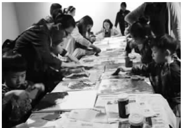
“重生与希望”亲子绘画活动