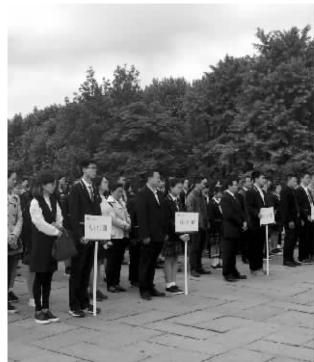
学生列队

快报讯(见习记者 舒越)“我是莲花学子,我爱我的父母,我爱我的老师……”5月5日,南京莲花实验学校初二200多名学生与父母来到雨花台烈士陵园,喊出青春誓言,迎来14岁“青春礼”。现代快报记者在现场了解到,这场特别的“青春礼”源于江苏省文明委下达抓好未成年人“八礼四仪”的要求,其中“四仪”就包括14岁青春仪式,教育引导未成年人强化文明礼仪素养。