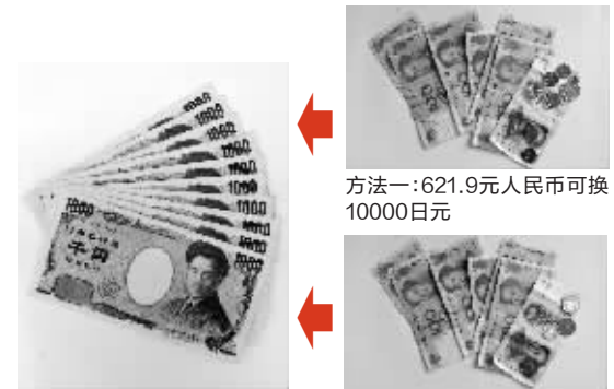
方法一:621.9元人民币可换10000日元