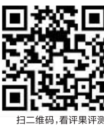
扫二维码,看评测评测