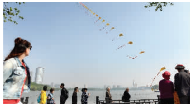
昨天,南京晴空万里,在玄武湖公园,一只漂亮的风筝吸引了不少游客驻足欣赏

快报讯(记者 徐岑)彻底升温前,总要先经历一波冷空气降温。说的就是4月25日这场雨。今天晚些时候,江苏将迎来一场雨。受冷空气影响,今明两天全省高温将下降5到7℃。这波降温后,江苏就将进入持续晴好升温模式。