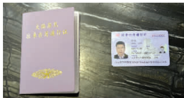
左为旧版纸质往来台湾通行证,右为新版卡片式往来台湾通行证

快报讯(通讯员 宫婧 见习记者 刘遥 记者 顾元森)根据公安部要求,江苏省启用电子往来台湾通行证,江苏省公安机关出入境管理部门自4月24日起全面受理电子往来台湾通行证的申请,同时停止签发现行本式往来台湾通行证。