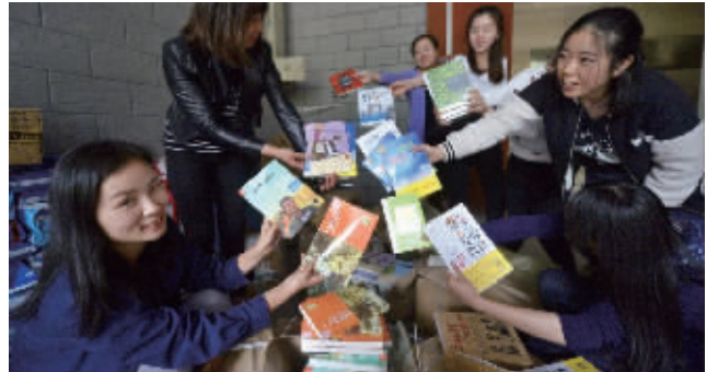
工作人员分拣图书,准备送往藏书处

值得一提的是,原江苏省作协专业作家、现南京市历史文化名城保护专家委员会专家薛冰,今天将会出现在老门东,他将作为本次“全民阅读·领读金陵”活动的城市领读者形象大使,与现代快报一起向全市市民推广全民阅读的理念。与薛冰一起担任形象大使的还有著名设计师、南京观筑历史建筑文化研究院院长陈卫新。也欢迎各位读者报名参加领读金陵活动,与薛冰、陈卫新一起,领读金陵!