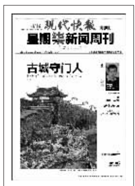
上期星期柒新闻周刊封面