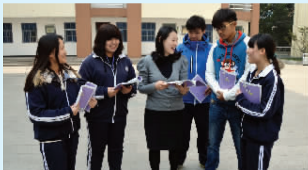
韩国外教和学生们交流