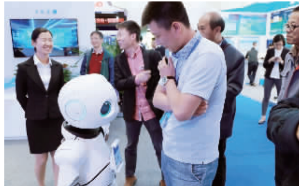
展会现场“优友”与参观者互动

在一场强调核心技术与未来网络的展会上,居然出现“网红”——会跳小苹果、自称8岁的“爷们”优友,几乎赢得了每一个参观者的好奇和关注。合影必不可少,就连“展会现场撩优友”也多次引发了围观。这是在4月17日—18日,在南京举办的2017全球未来网络发展峰会特别展上,中国移动展区的一幕。