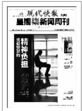
上期星期柒新闻周刊封面