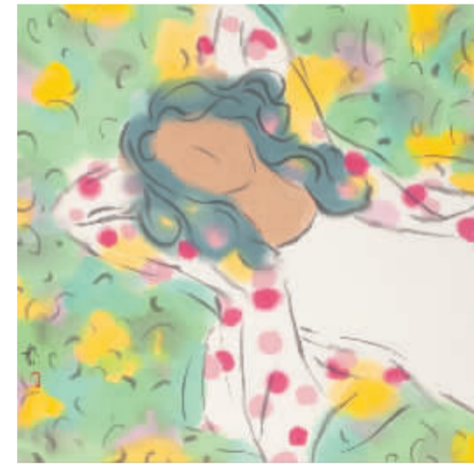
王竞作品《翅膀飞过的痕迹》纸本水墨 尺寸68cm×69cm 2015