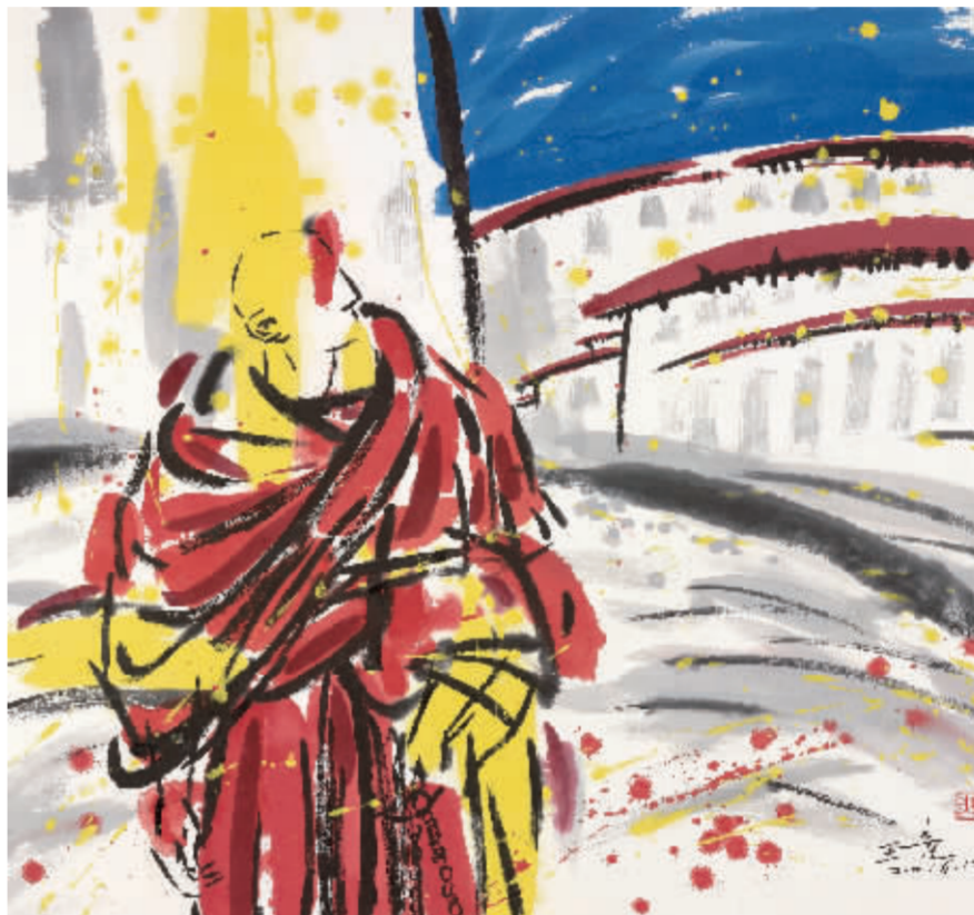
王竞作品《那一世》纸本水墨 尺寸90cm×97cm 2017

王竞水墨作品给我最大的感受就是作者的用色和构图富有诗意和灵巧,尤其用色,丰富而不突兀,整个作品生动,简约但内涵不单薄,带有东方人特有的情调,作品既有强烈的现实体验,又有梦幻式的抒情。它不同于当今市场上很多已陷入程式化的传统的山水画,不