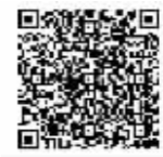
扫码看纪念馆开馆直播回放