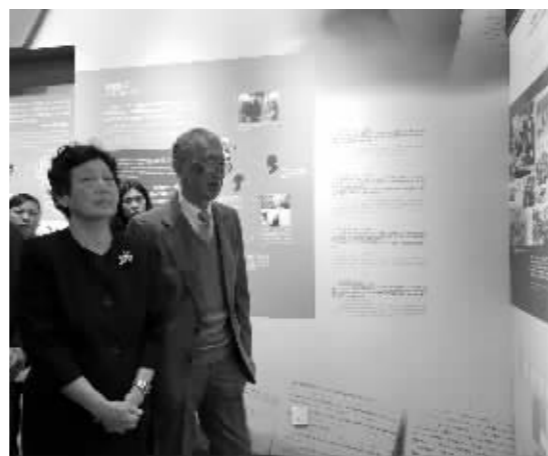
张纯如父母参观纪念馆

日军南京大屠杀暴行,揭示张纯如发现《拉贝日记》等关键史料,写作《南京大屠杀》,对揭露日军暴行的特殊贡献;第四部分为“激情燃烧的历史捍卫者”,展示张纯如为维护正义,在北美各地售书、演讲、辩论;第五部分为“不能停止的求索之旅”,展示张纯如创作《蚕丝:钱学森传》《美国华人》等作品,体现其根在中华的赤子之心;第六部分为“光照人间正义天使”,反映国际国内对张纯如短暂而光辉一生的高度评价,对其英年早逝的深切缅怀。