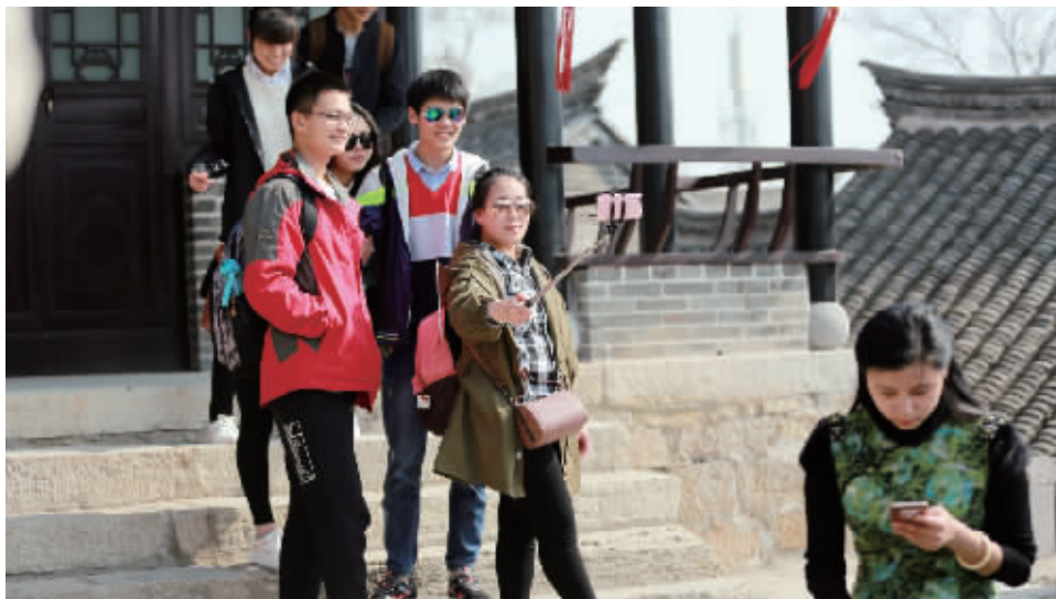
游客在户部山古民居园内自拍留影

为推动全民阅读,助力书香城市建设,传承弘扬传统文化,凸显徐州户部山的文化地位,“诵读户部山”徐州最美诗词朗诵大会启动。本次活动由户部山(回龙窝)历史文化街区管理中心、云龙区文化旅游局、云龙区教育体育局主办,现代快报徐州新闻中心承办。