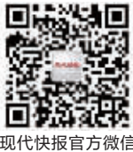
现代快报官方微信