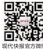
现代快报官方微博