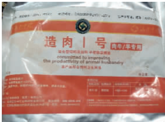
央视曝光的“造肉1号”