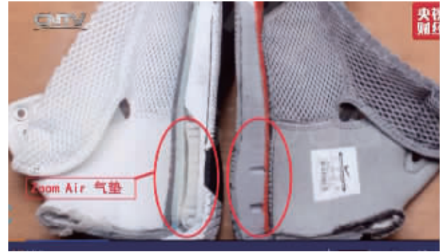
消失的气垫(右)