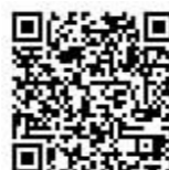
扫码看濮存昕诵读《梅花》视频

接受现代快报记者采访时,他还不忘为家乡梅花代言,“欢迎全国各地的朋友到溧水看漫山遍野的梅花。”对于这首《梅花》,濮存昕特别钟爱,在他的公众号“濮哥读美文”中,还专门为《梅花》制作了一期朗诵音频。