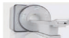
西门子3.0T MAGNETOM Skyra核磁