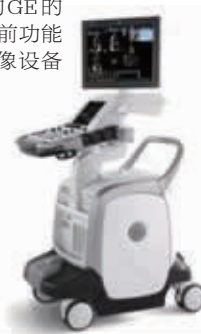
GE LOGIQ E9 彩超