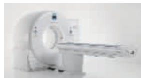
西门子128排炫速双源CT

"全国CT战略部署计划"，到目前为止，爱康已在全国20多个城市和区域都部署了来自全球先进品牌西门子、GE、飞利浦等品牌的CT设备；其中包括多台64排CT。在北京、上海的爱康君安旗舰中心，爱康还斥巨资配置了西门子128排炫速双源CT和光子双源CT。