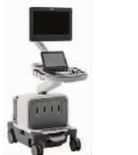
PHILIPS EPIQ5 彩超