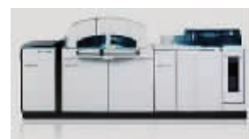
罗氏生化免疫一体机