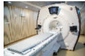
GE 3.0T Discovery MR 750w核磁共振