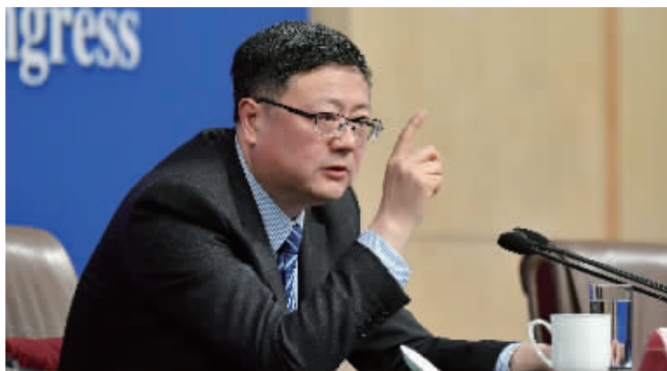
环保部部长陈吉宁答记者问