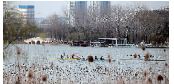
天气晴好,春意渐浓,南京水上运动学校的运动员们在玄武湖上训练

快报讯(记者 徐岑) 晴暖升温正式拉开序幕啦!3月7日起,冷空气的影响彻底过去,气温开始飙升,今明两天高温都在15℃左右,后天升至18℃,星期五最高气温将达到20℃左右。不过,未来几天最低温度一直在0到3℃徘徊。早晚气温低,昼夜温差会很大,提醒大家注意保暖。