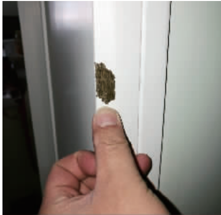
漆用指甲轻轻一抠就掉落