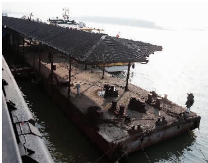
百年趸船近期将进行文物认定工作