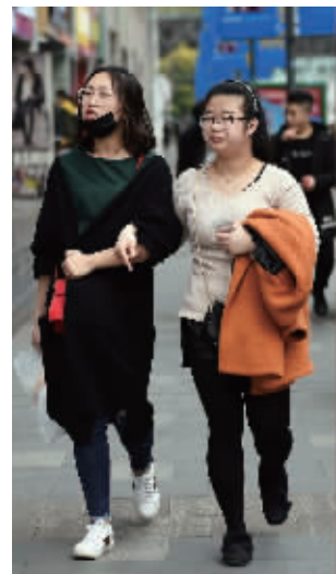
昨天南京街头不少行人脱下了外套