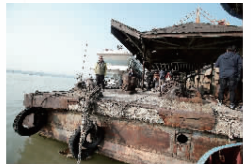
趸船“退休”后就停在南京中山码头南岸右侧