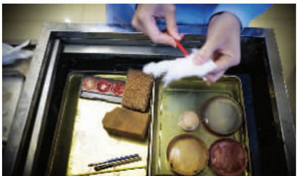
入殓师细心擦拭整容的工具