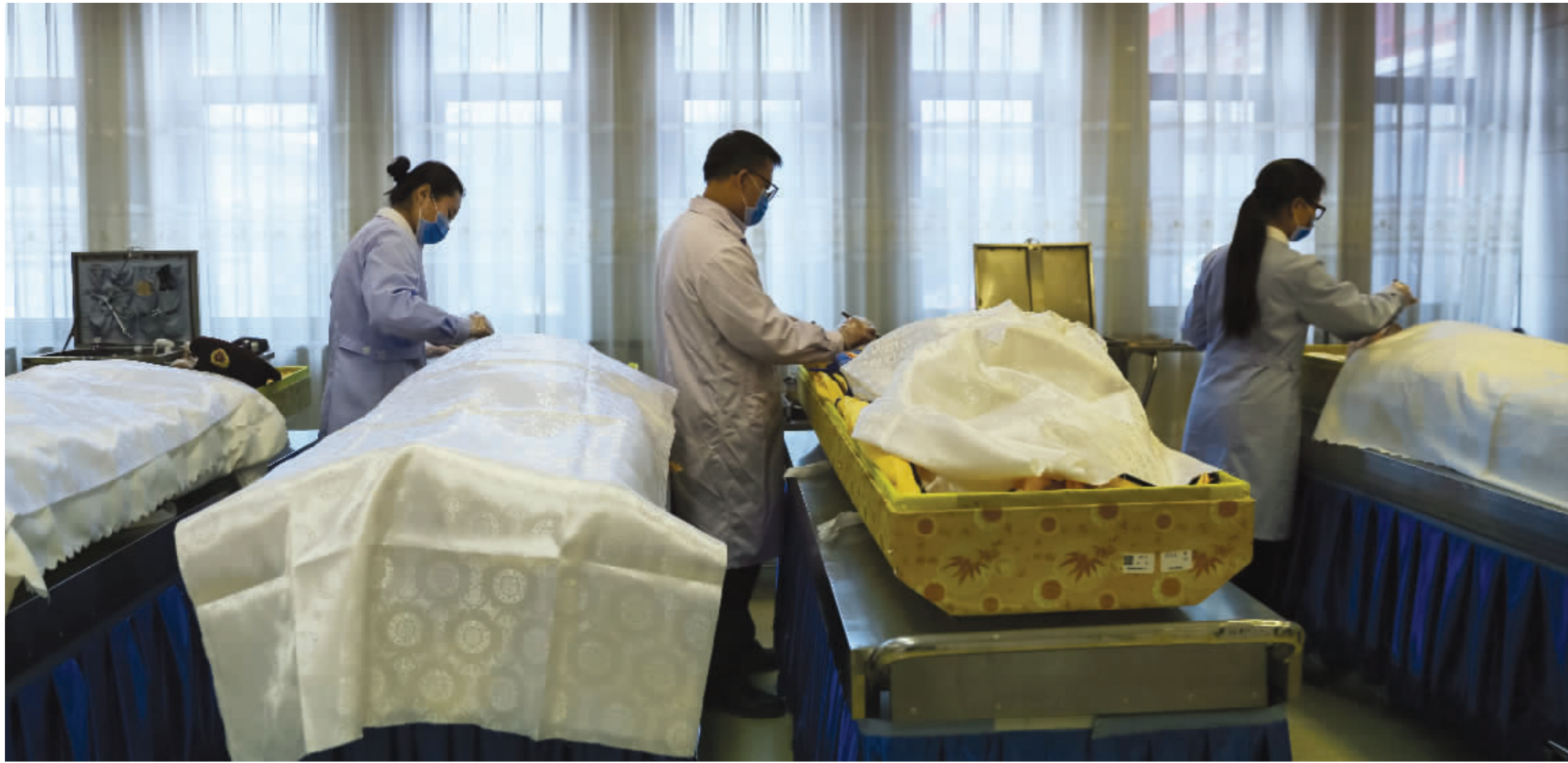
入殓师的心愿就是让逝者有尊严地走