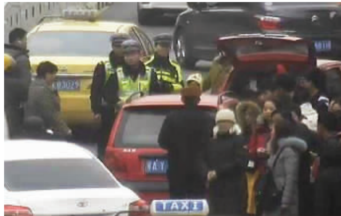
监控拍下黑车停在公交站台旁拉客并被交警拦截查处的画面

快报讯(通讯员 郎伟超 记者 王瑞)油坊桥地铁站附近经常出现违停拉客小车,占用公交站台,还给道路添堵,存在不小的安全隐患。2月21日下午,南京交警四大队民警对莲花路开展集中整治,当场查获7辆违停拉客小车。建邺区莲花路为双向混合车道,紧邻油坊桥地铁站与莲花路公交站等交通中心以及天迈广场、油坊城等综合商业广场。长期以来,每逢上、下班便迎来人流高峰,黑车趁机违停揽客,使原本车多缓行的莲花路拥堵更加严重。2月21日下午,南京交警四大队