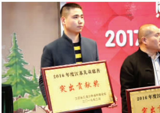
新生植发一直为爱心公益事业而努力

2016年5月,新生植发携手江苏省儿童少年福利基金会正式启动“向爱出发”大型公益助学活动。新生植发承诺每实施一台植发手术,就以发友的名义向“新生助学基金”捐赠100元人民币,全额用于公益助学。据了解,新生植发助学活动仅2016年6-12月就已经相继走访了南京六合区和高淳区的4所小学和中学,先后对当地近200名中、小学生实施了爱心捐助。对于脱发朋友,新生植发的公益理念是雪中送炭,给那些贫困人群免费植发或优惠植发。新生植发多年来一直秉持雪中送炭的公益理念,差不多每个月都有一个贫困发友得到免费植发,若干发友得到优惠植发。新生植发在公益援助时是不考虑回报的,并不一定是非要选择一个能给医院带来广告效应的贫困脱发者,倘若有了“回报”动机,那就不是真正的