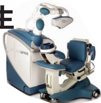
医院引进的植发机器人