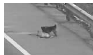
小狗不离不弃守护同伴

快报讯(记者 李伟豪 通讯员 陈凯)一只小狗被车撞倒在地,同伴默默依偎在旁边,久久不愿离去,令人动容。这是2月18日发生在徐州境内高速公路上的感人一幕。