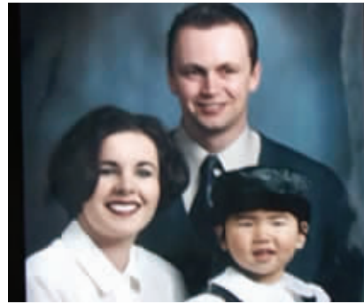
女孩和她的加拿大养父母(翻拍)