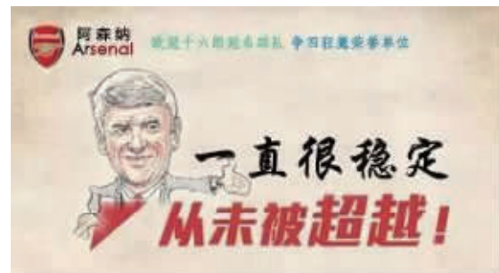
“争四狂魔”“欧冠十六郎”一直很稳定