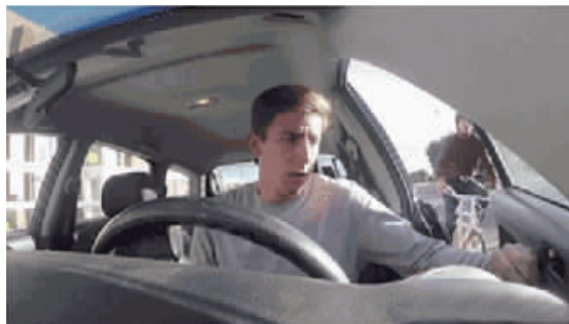
小伙伴们,来找找这两张图有哪些不一样 (答案在文末)