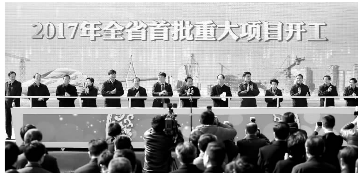
2月12日,2017年全省重大项目集中开工现场推进会在南京江北新区举行

通讯员 朱莉莉 秦卫娜 董海兵 惠子 严帅 诸定翔 杨长喜 现代快报/ZAKER南京记者 鹿伟 徐岑 杨菲菲 项凤华 余乐 朱鲸润 匡笠 刘国庆 见习记者 赵冉