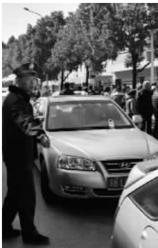
城管帮助维护校门口交通秩序

鉴于此,执法人员对学校开具了责令改正通知书,责令校方限期拆除设置在李巷路上的所有铁桩并修复被损坏的路面。下一步,城管部门将会同校方、交警部门以及其他相关部门共同做好该地区的停车和护学问题,确保道路畅通和小朋友的人身安全。