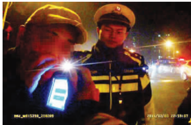
交警让涉嫌酒驾者吹气检测

通讯员 浦公轩 乐剑 侯静雅 江公宣 姜飞 牟霞 杨凯 吴晓辉 现代快报/ZAKER南京记者 王瑞 顾元森 陶维洲