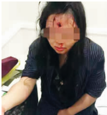
一位女游客头部中枪

中国驻南非约翰内斯堡总领事馆5日向记者证实,三名中国游客4日在约翰内斯堡一家酒店办理入住手续时遭不明身份歹徒劫掠受伤,其中两人受到枪伤。目前三人生命体征平稳,已转入普通病房。