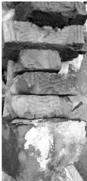
荒地上的古砖