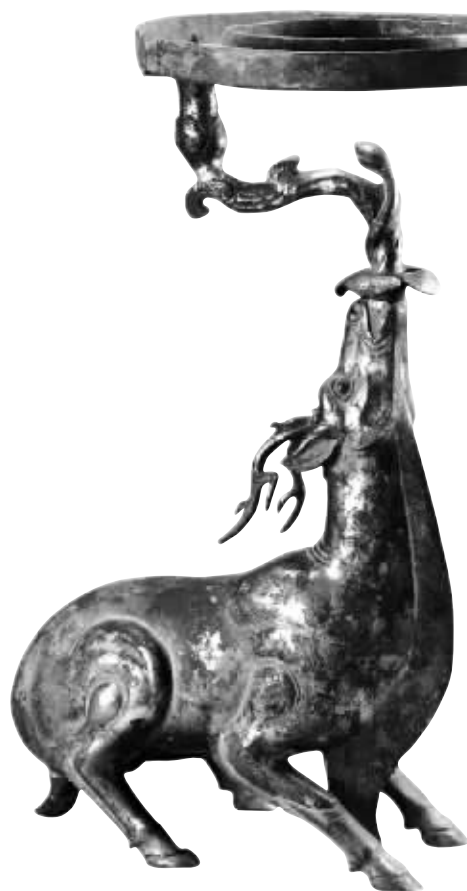
鎏金铜鹿灯(以上均为南博资料图)

南京博物院相关负责人介绍,这是大云山汉墓出土文物第一次出国办展,参展文物经过双方精心甄选。旧金山亚洲艺术博物馆在官方微信上称,“旧金山亚洲艺术博物馆是这次展览唯一的展出场所。”