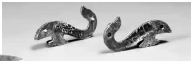
“长毋相忘”铭银带钩