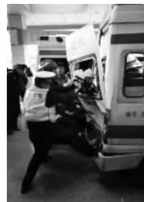
消防队员正努力撬开车门 请供图网友联系我们领稿费

在医院门口，医护人员要送患者下车时，发现车尾两扇变形的门打不开了。情急之下，只好拨打119向消防求助。5分钟后，消防队员赶到现场。