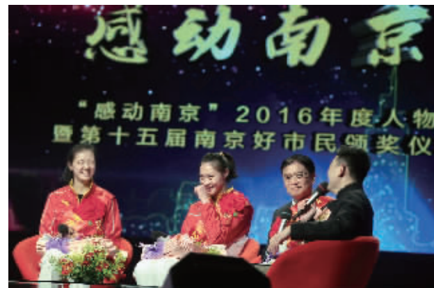
“感动南京”人物颁奖