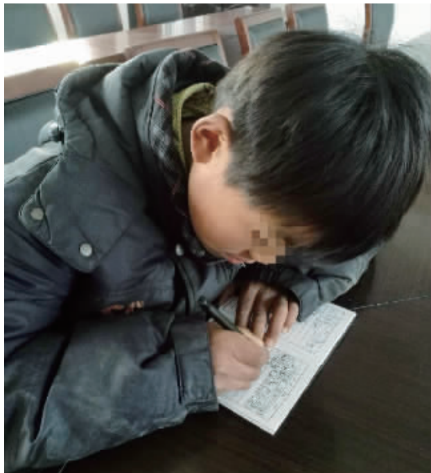
闯祸的小横写下检查