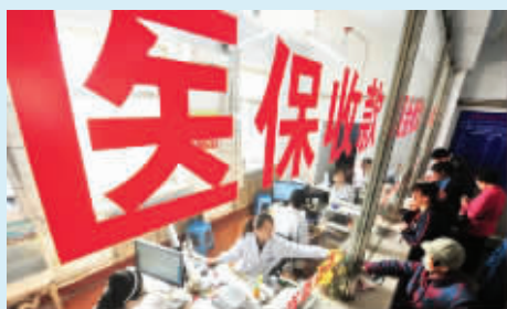
无锡医保大市一卡通