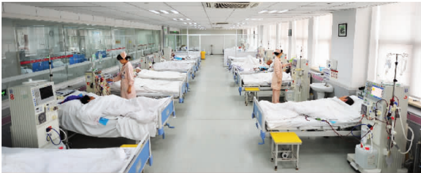
无锡八院血透中心