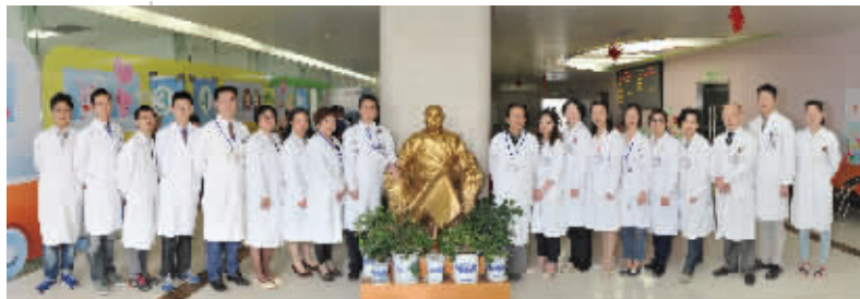
无锡八院儿科团队

鼎力人才建设，实施科技兴院。值得一提的是，无锡八院创立了“雏鹰、飞鹰、精鹰、雄鹰”四大人才计划，不断创新人才引进渠道，广纳群贤、人尽其才。2016年无锡八院通过多途径成功引进麻醉科、心内科、骨科、普外科、呼吸内科、耳鼻喉科、泌尿外科、中医科、肛肠科等30名副高以上高端专业技术人才。同时，注重人才梯队培养，构筑医院战略人才库，重点培养了一批技术骨干。