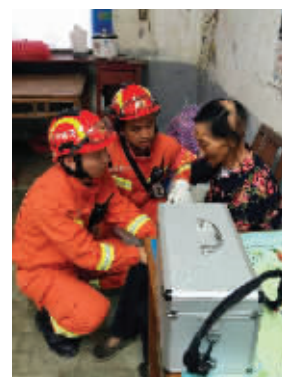
6·23无锡消防增援盐城阜宁龙卷风灾害事故