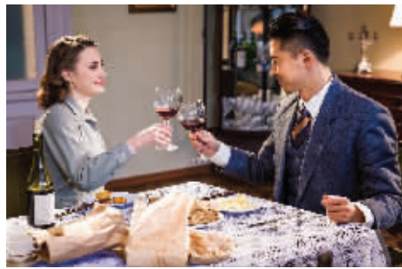
《最后一张签证》剧照