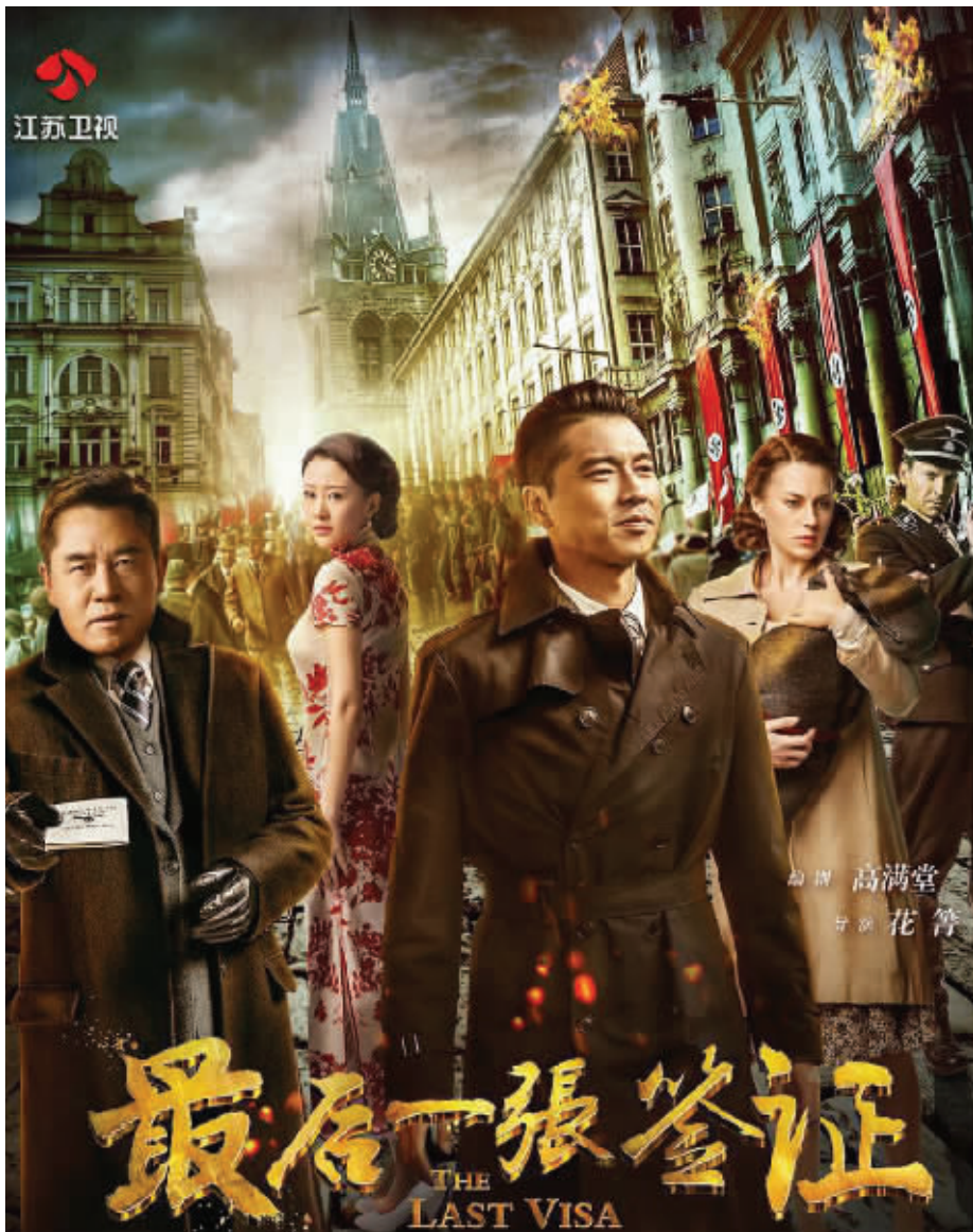
《最后一张签证》海报

另据知情人爆料，小鲜肉开出的片酬高达6000万，同时要求拥有该剧20%的干股。这些制片方也没有说什么，但他提出要改剧本。“他觉得高老师写的本子不够时尚，他说不出那样的台词，要带一个编剧进入剧组改剧本，但实际上就是个刚入行的小写手。”无礼要求之前，凭借《闯关东》《老农民》《钢铁时代》等一系列热门剧被观众熟知的编剧高满堂忍无可忍，明确提出换人，而这样的要求也超出了制片方的底线，于是，之后才有了今天王雷主演的普济州。